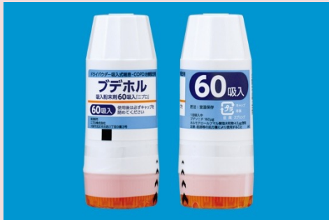
ブデホル吸入粉末剤60吸入