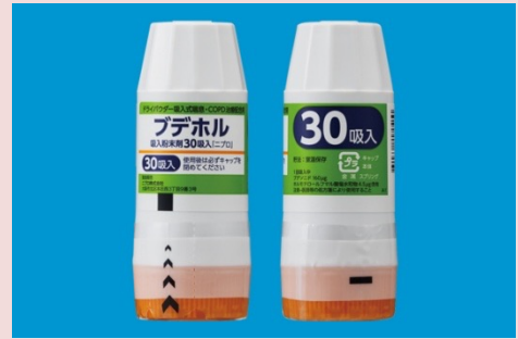
ブデホル吸入粉末剤30吸入