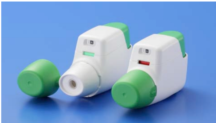
エクリラジェヌエア