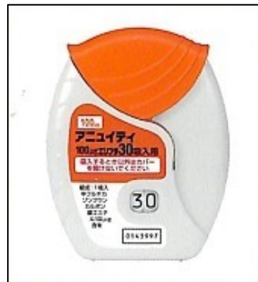
アニュイティエリプタ