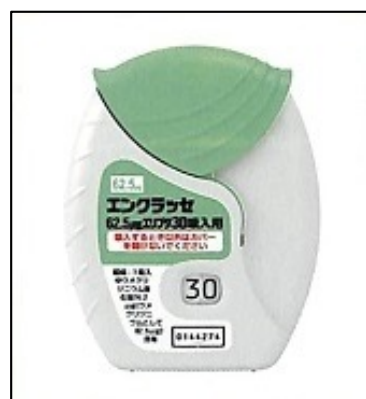
エンクラッセエリプタ