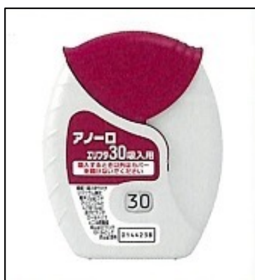
アノーロエリプタ