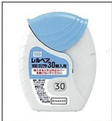
レルベアエリプタ