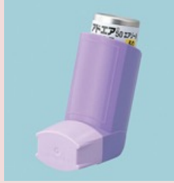
アドエアエアゾール