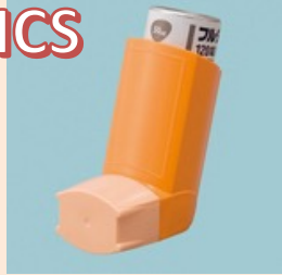
フルタイドエアゾール