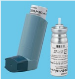
サルタノールインヘラー