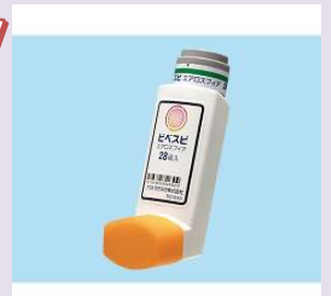
ビベスピエアロスフィア