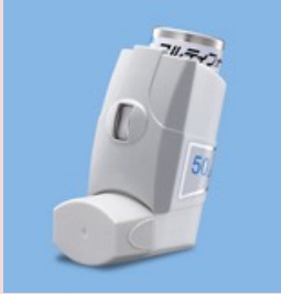
フルティフォーム