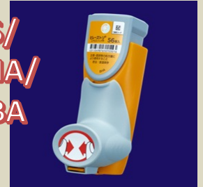
ビレーズトリエアロスフィア