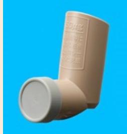
キュバール エアゾール