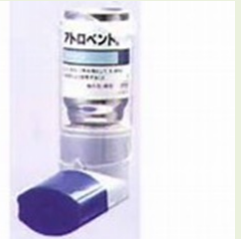
アトロベントエロゾル