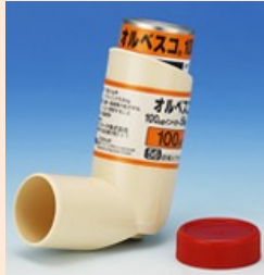
オルベスコ インヘラー