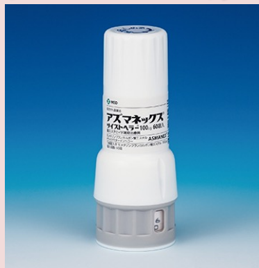
アズマネックス ツイストヘラー